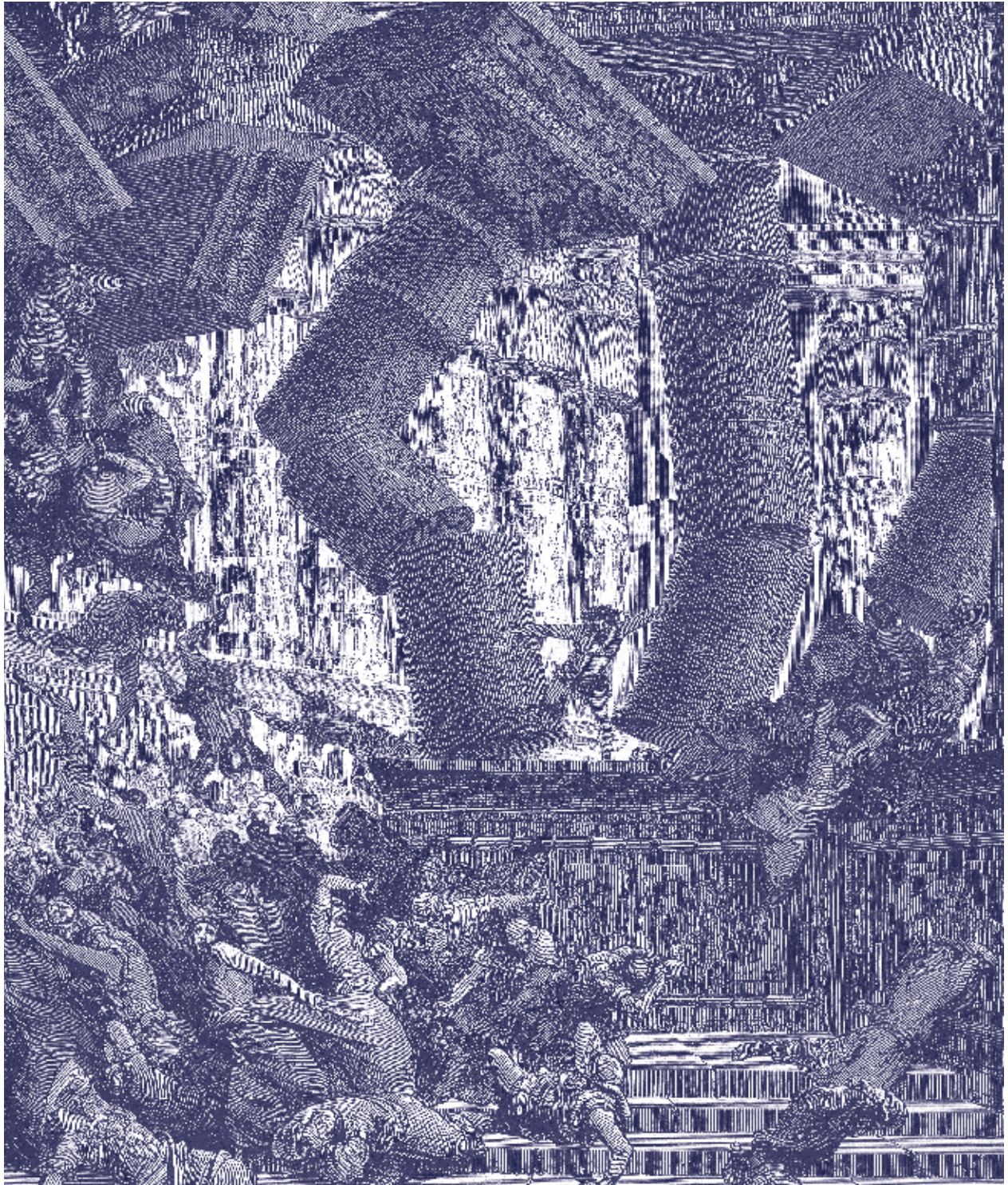
De dood van Simson, G. Doré.

verder uit verdwijnen moet. Nu zeg ik het allemaal wat snel en zonder nuances. En toch is dit de kern van wat ik zeggen wil in dit artikel en in het boek dat ik net afgerond heb. Dus commissies van vorming en toerusting, prioriteit voor deze vragen in de gemeente a.u.b!