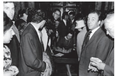
Signeren na afloop van een concert in de Oude Kerk te Amsterdam.