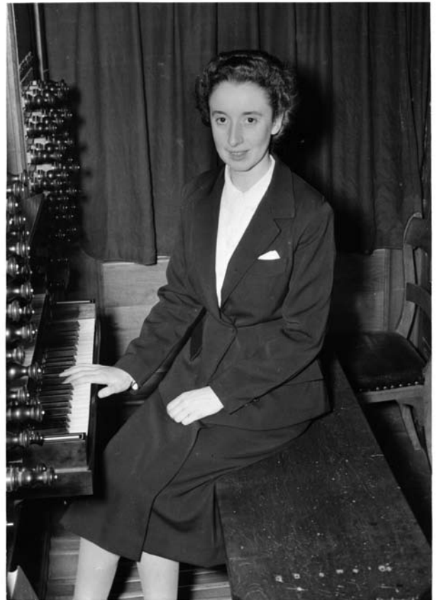
Aan het orgel van de Pieterskerk in Leiden, 26 september 1949.

Nadat een docentschap in Parijs aan haar voorbijging werd ze docente in Nancy in 1952 en vervolgens in Luik, de geboorteplaats van César Franck. Hier werd als proeve van bekwaamheid een verhandeling van haar geëist