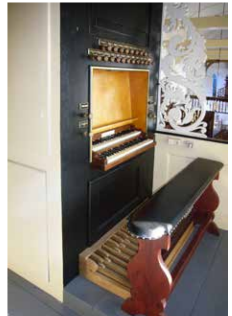
De klavieren van het orgel van Kimswerd, met weer de oude (gerestaureerde) orgelbank en gereconstrueerd pedaalklavier.

werden ingeruild voor een Gamba en een Voix Celeste; in 1918 en 1922 was er herstelwerk aan ondermeer de klavieren. In 1964 werden door Wim Eppinga uit Britswerd bij een niet in stijl passende restauratie deze stemmen vervangen door andere uitersten: een Terts 1 3/5 vt en Quint 1 1/3 vt. Het aangehangen pedaal werd uitgebreid met cis 1 en d 1 , met een nieuw pedaalklavier en orgelbank. Een pneumatische tremulant werd aangesloten op de knop Ventiel. Er kwam een nieuwe windmachine. De orgelkast werd geverfd in ‘Pruisisch blauw’ en de frontpijpen werden gepolijst. In 2012-2013 werd het orgel opnieuw gerestaureerd. Hierbij werden tevens