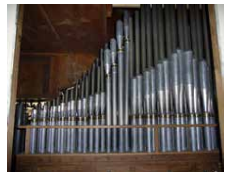
Zicht op het bovenwerk van Kimswerd. Bij de nieuwe Vox Humana moesten ter plekke diverse stevels extra worden verlengd om een bevredigend klankresultaat te krijgen. Tussen (doorslaande) tongen en stevellengtes bestaat namelijk een duidelijk relatie.