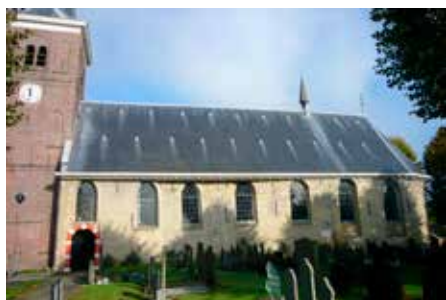
De kerk van Easterlittens vanuit het zuiden, met de dakruiter.

De destijds aan St.-Margaretha gewijde kerk, twaalfde-eeuws en in tufsteen, werd een eeuw later uitgebreid met een rondgesloten koor. In 1854 werd de toren ommetseld en het zadeldak vervangen door een ingesnoerde helmspits. Niet alledaags is dat op het kerkdak een kleine dakruiter staat met een (angelus)klokje. Aan de noordkant staat een sacristie die in de negentiende eeuw een ander aanzien kreeg. In dit bijgebouw bevindt