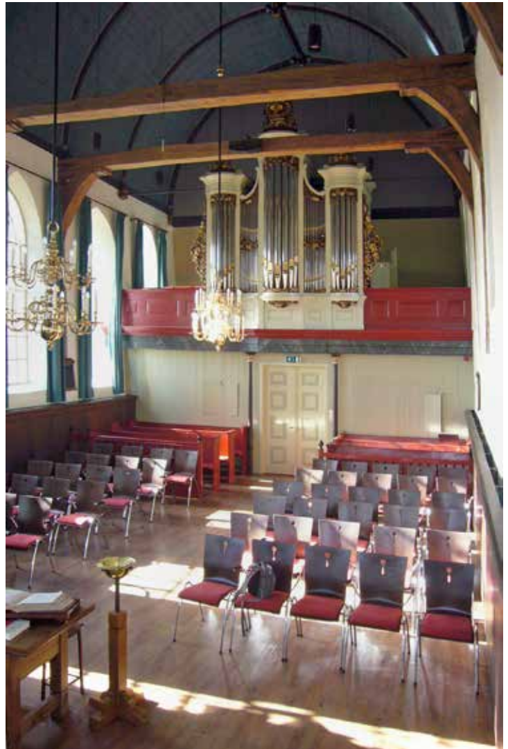
Het Hardorff-orgel (1876) te Hantum. Rechts op de galerij een deel van het balghuis. De klaviatuur bevindt zich eveneens rechts, met daar anderhalve meter naast de plaats waar van 1876 tot 1964 de orgeltrapper aan het treden was. Je zou als organist vlak voor kerktijd maar ruzie met hem hebben gekregen ...

Bij de bouw had Hardorff gebruikgemaakt van ouder materiaal, wat te herkennen valt aan de inliggende voorslagen – ongebruikelijk voor