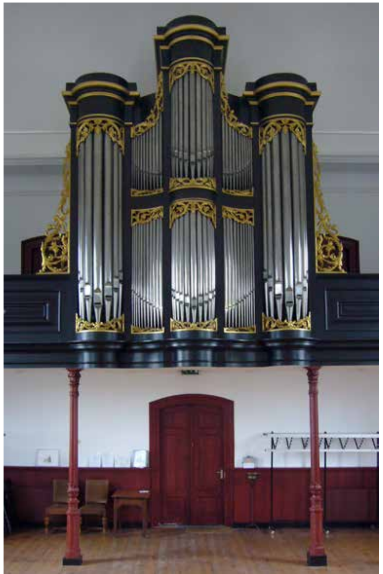
Het Hardorff-orgel (1857) te Nieuw Beerta.