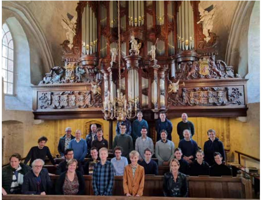
Jury, organisatoren en deelnemers aan het concours.