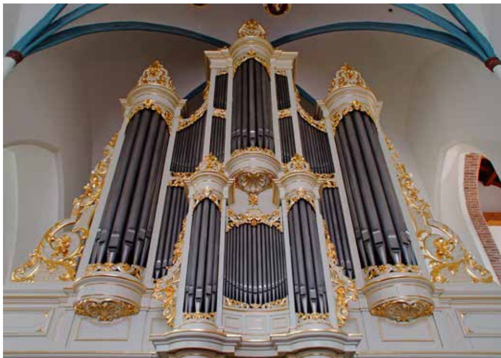
Het Van Dam-orgel in de Oude Kerk.