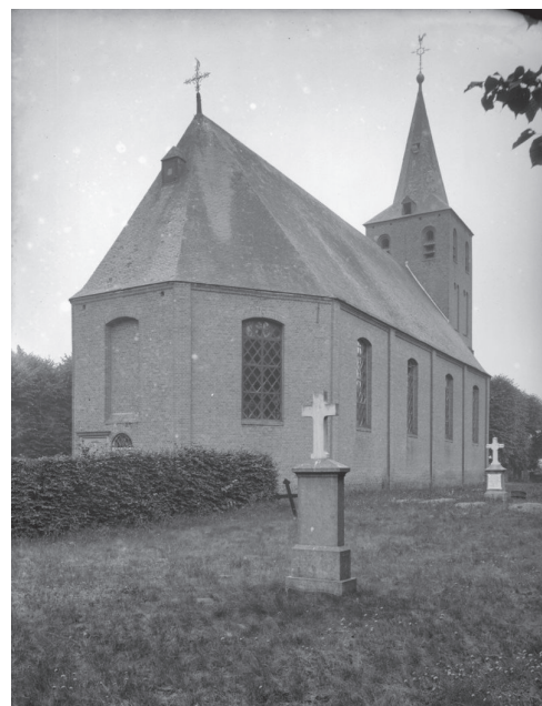
De dorpskerk in Reek uit 1790.