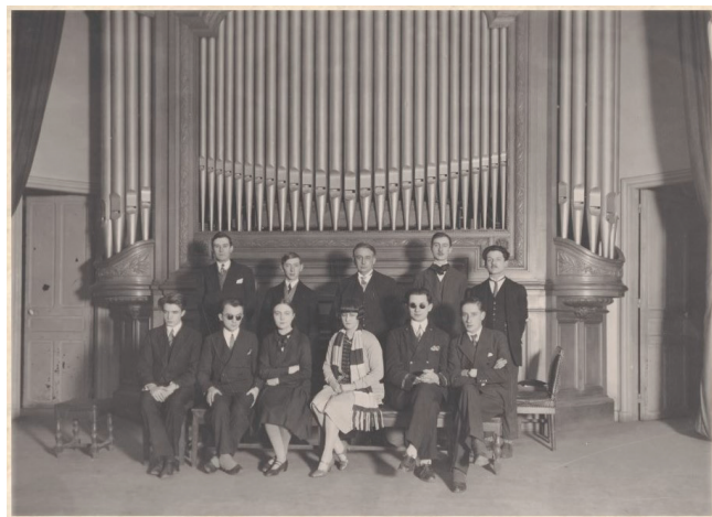
De orgelklas van Marcel Dupré, 1929-1930. Met op de voorste rij Jean Langlais (tweede van links) en Gaston Litaize (tweede van rechts).

Messiaens wereldberoemde La Nativité du Seigneur stamt uit 1935. In negen meditaties schetst hij het verhaal van de geboorte van Christus. Nu eens komen de onderwerpen concreet uit het kerstverhaal zoals 'de maagd en het kind' (deel 1), 'de herders' (deel 2), 'de engelen' (deel 4), 'de wijzen' (deel 8), dan weer gaat het om mystieke vergezichten, waarin Messiaen zijn theologische visie op het kerstverhaal en zijn religieuze beleving ervan centraal stelt. Langlais componeerde al enkele jaren eerder zijn gelijknamige werk. Na Adoration des bergers uit 1929 verschenen in 1931 drie Poèmes évangéliques d'après les textes sacrés : 1. L'Annonciation ; 2. La Nativité ; 3. Les Rameaux waarvan de eerste twee meditaties betrekking hebben op de geboorte van Christus, en de derde verwijst naar de intocht van Jezus in Jerusalem. En nóg was het hem niet genoeg: in 1934 bewerkte hij La Nativité voor orkest en orgel. Langlais en Messiaen waren niet de eersten en evenmin de laatsten in de