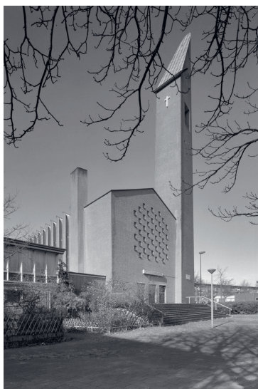
De Opstandingskerk te Amsterdam.