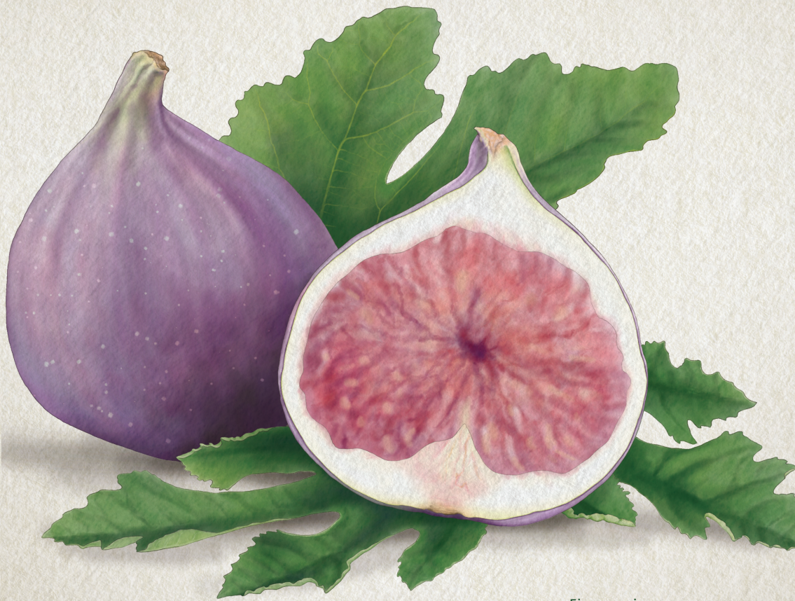
Ficus carica Hebreeuws: teen, teenah Grieks: sykè