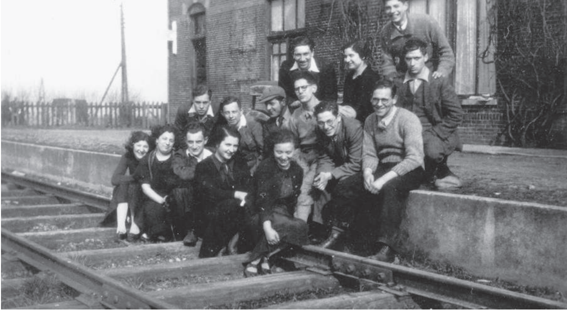
Groepsfoto op perron en rails bij het kibboetsgebouw, wellicht bij de opening van het nieuwe gebouw op 9 juni 1935