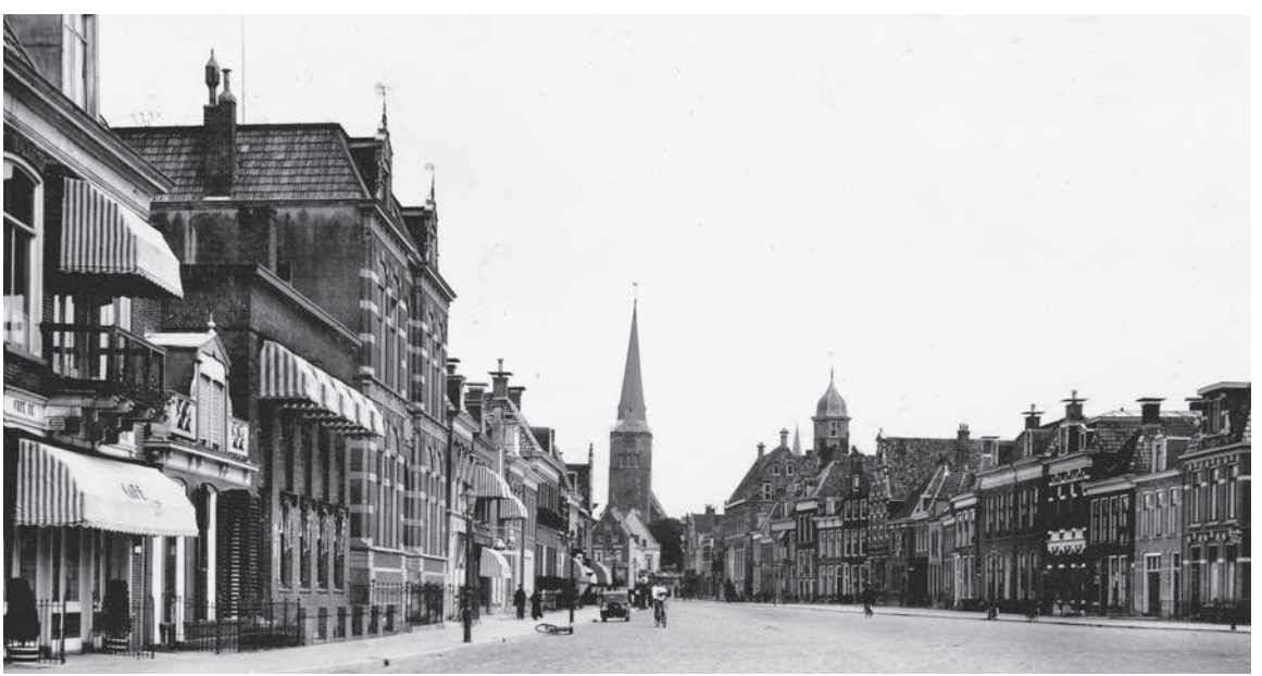
Voorstraat, met helemaal rechts Huize Camper, 1936