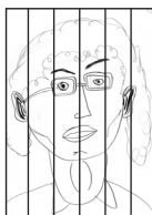
NAAM: SUE TAYLOR WISDAAD: NEEDING TO BE GOEWIL IN ALLES GOED ZIJN