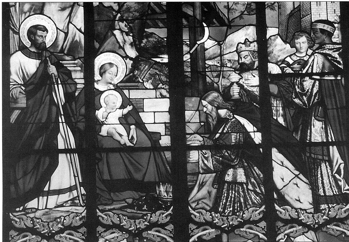
Gebrandschilderd raam in de Cathedraal te Tours

de aardse menselijke koning naar de hemelse koning die de mens had geschapen. Zij vragen de volwassene naar het kind, de verheerlijkte naar het verborgene, de verhevene naar het nederige, de welbespraakte naar het sprakeloze, de vorstelijke naar het behoeftige, de sterke naar het zwakke. En ofschoon zij toch de vervolger Herodes vragen naar de Christus die over hem en anderen heerst, vragen zij de minachter naar degene die gehuldigd moet worden. Voorzeker, in wie men geen koninklijke praal ziet, wordt de ware majesteit aanbeden' (s. 373,2).